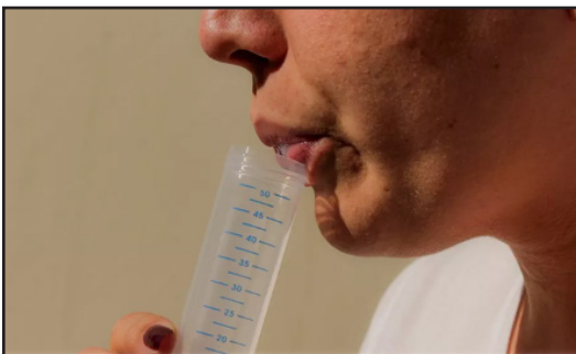
Salivar sense escopir dins del tub gran