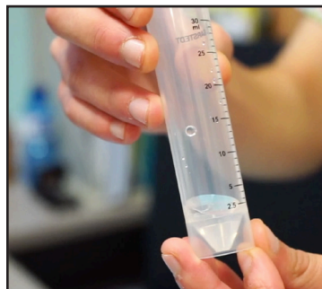
Omplir el fons cònic del tub