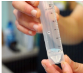
Llenar el fondo cónico del tubo